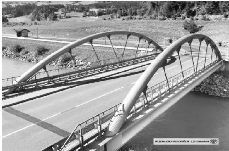
Brücke ähnlicher Bauart über die Salzach in Hollersbach

Die bestehende Brücke wird während der Bauzeit möglichst lange in Betrieb gehalten, um den Verkehrsfluss zu gewährleisten.